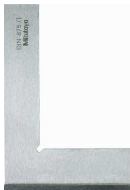
Поверочный угольник с буртиками